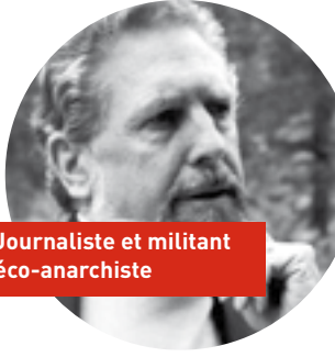
Journaliste et militant éco-anarchiste