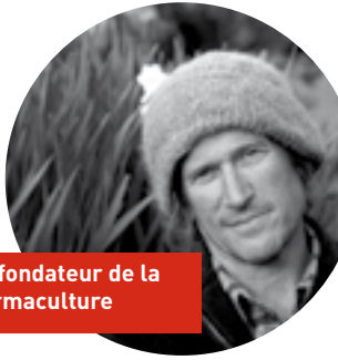
Le fondateur de la permaculture