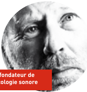
Le fondateur de l'écologie sonore