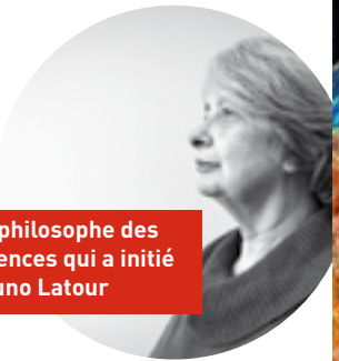
La philosophe des sciences qui a initié Bruno Latour