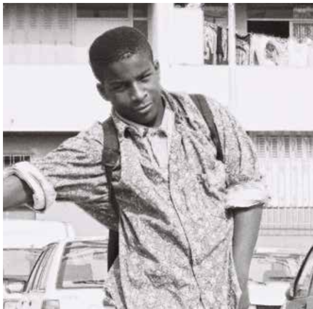
L'auteur, vers 1995 à Marseille.