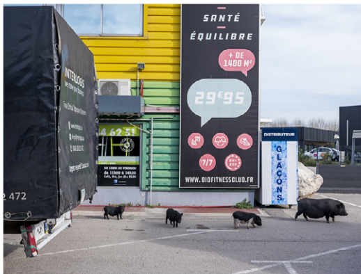
Cochons sauvages, zone industrielle de La Palun, Marignane (13), 2022