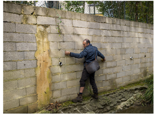
Fafilement dans le lit de la Valentine, un affluent de l'Huveaune, Marseille, 2014 série La Promenade du milieu , avec le collectif SAFI