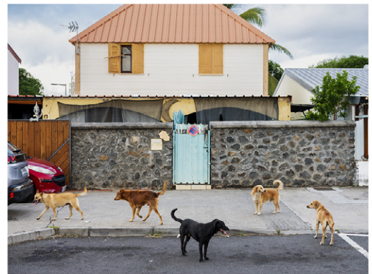
Chiens errants et divagants, boulevard de Strasbourg, Le Port (La Réunion), 2022